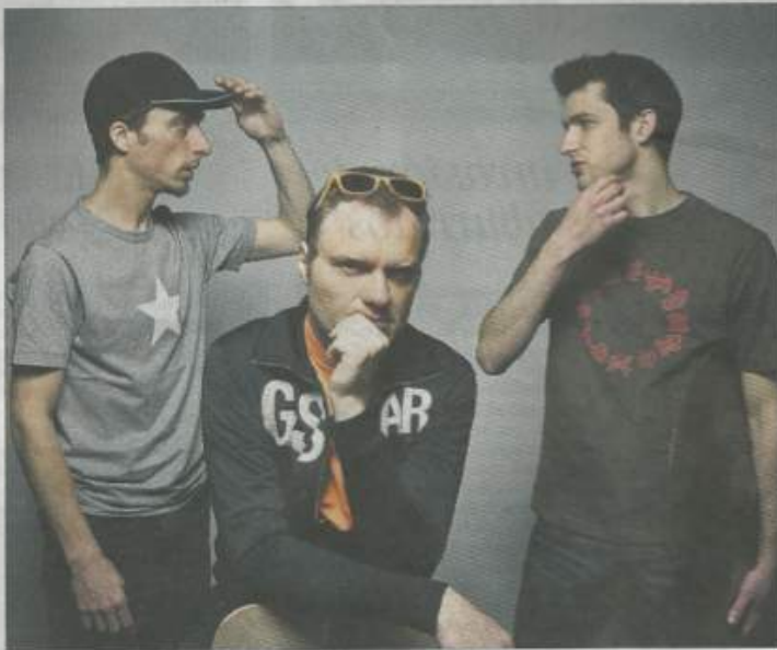
Disco. El trío gestó su primer álbum durante una gira por Asia y lo publicará en noviembre.

A Cédric le gusta tomar riesgos tanto en vivo como en el estudio de grabación, para imprimirle a su obra el espíritu de la creación en tiempo real. El legendario saxofonista Greg Osby dijo sobre él: "Hanriot corre sus límites más allá que la mayoría de los artistas de jazz. No tiene miedo de trascender sus fronteras musicales en cualquier momento lo que le permite acceder a lo prohibido e inimaginable". En ese sentido, el francés elige la mezcla, los contrastes y las superposiciones de estilos y sonidos como regla. Combina el piano acústico con efectos de