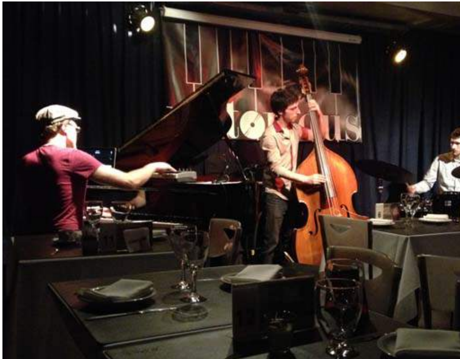
GroOovematic plays at Notorious Jazz Club

GroOovematic is a dynamic jazz trio from France that combines modern influences from music genres like funk, electro, and hip-hop with traditional sounds to create their own eclectic style. The group is touring through Argentina this month to promote their first album, the self-titled compilation GroOovematic, to be released in November.